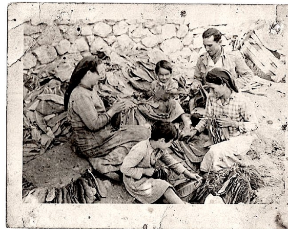
Οικογενειακό αρμάθιασμα του καπνού (1950)